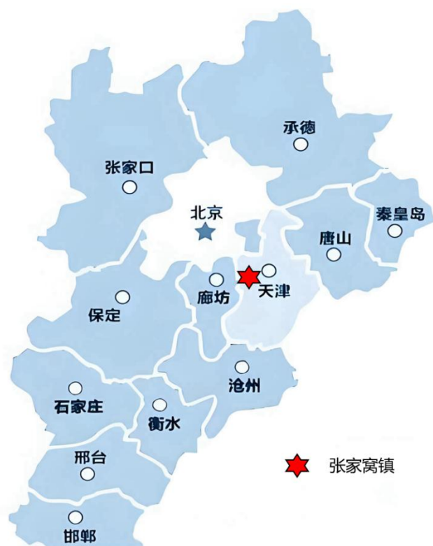
图 1 “京津冀地区”张家窝镇区位图